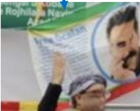
“Free Öcalan”(オジャランを解放しろ)のメッ セージ